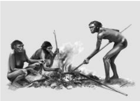
La maîtrise du feu

1. Découpe et colle dans l'ordre chronologique les événements ci-dessous. Écris ensuite sous chaque image la date qui correspond à chacun d'eux.