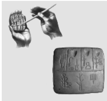
L'apparition de l'écriture