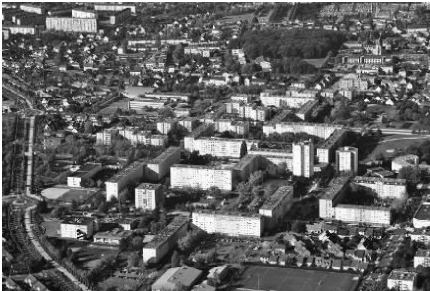
Document 2, p. 63

1. Quel type de paysage cette photographie représente-t-elle ?