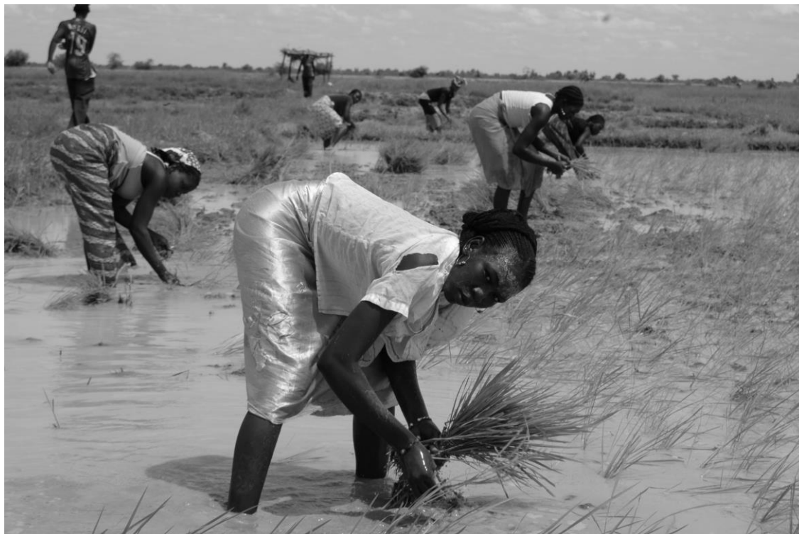
Femmes dans une rizière au Mali - Photo du film "Du riz et des hommes". Un film de Sophie Cailliau, Charlotte Gille, Antonella Lacatena, Nicolas Stinghambert et Yann Verbeke. Une production Association Switch – 2008.