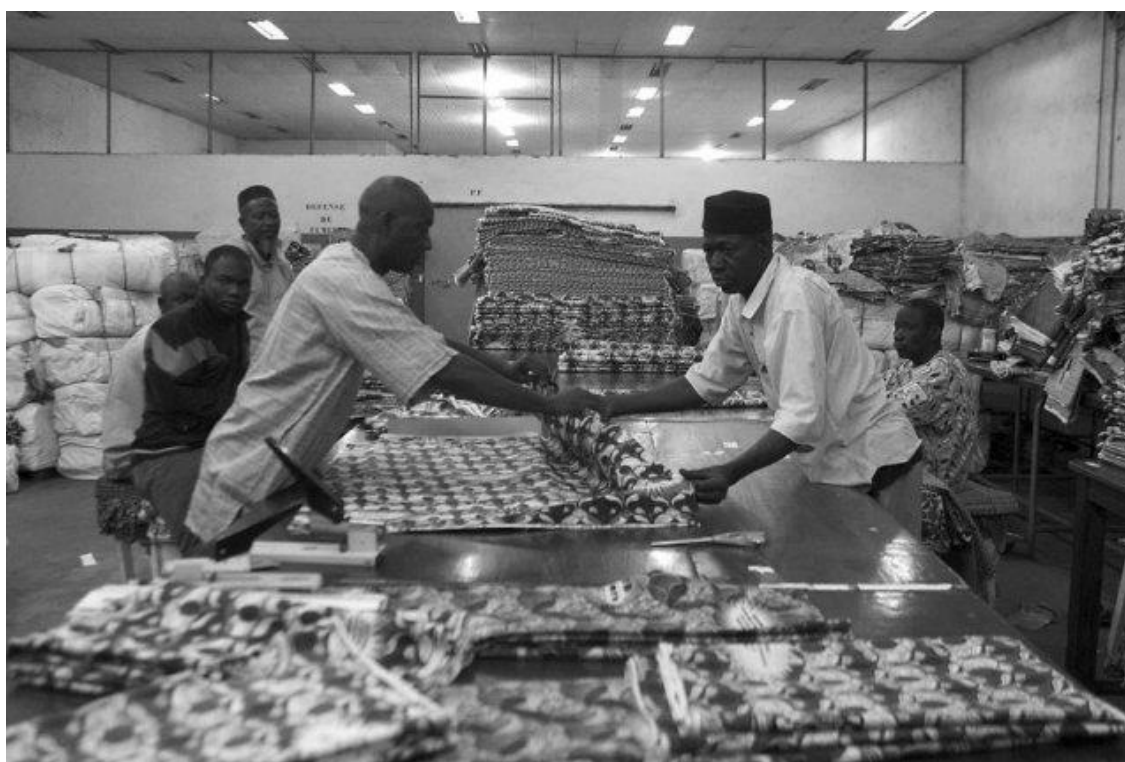
Employés dans une usine textile au Mali, 2012