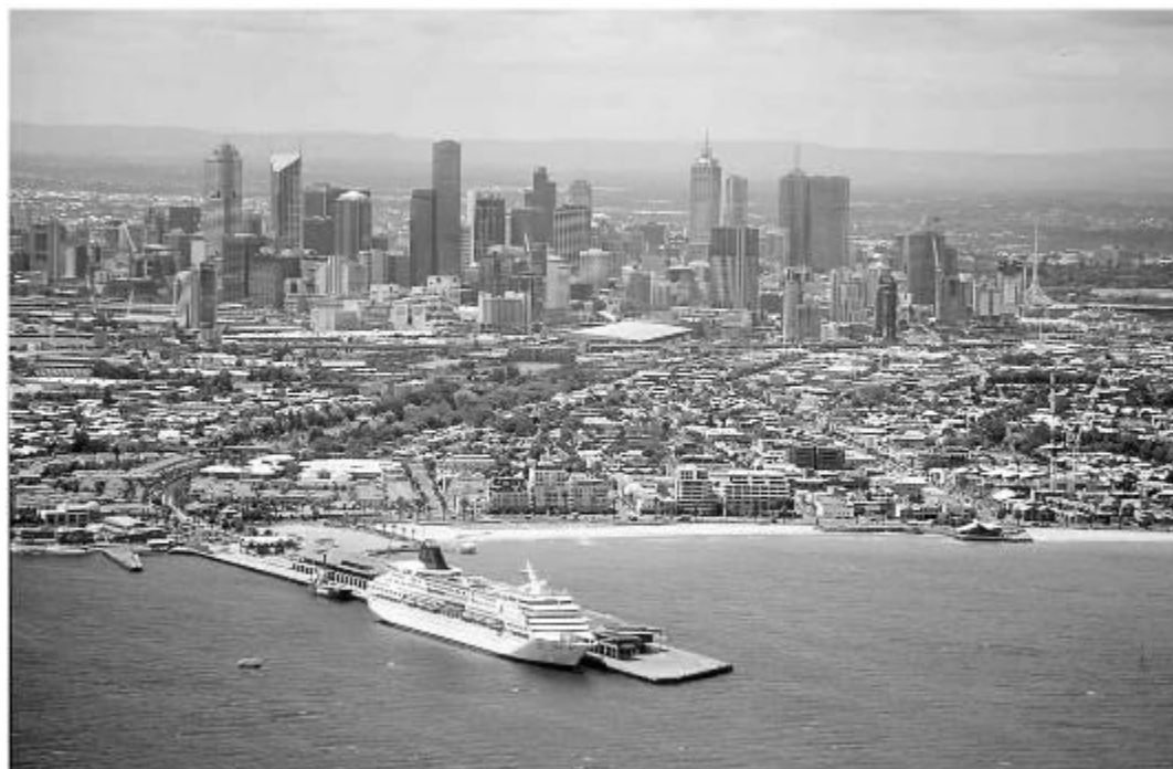
Vue de Melbourne, Australie